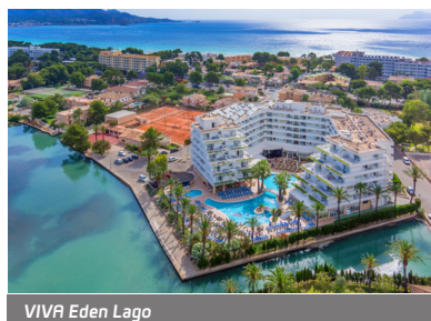
VIVA Eden Lago