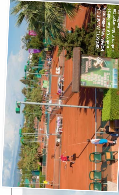
GRÖSSTE ANLAGE EU-ROPA'S: Was willst man mehr? 69 Sandplätze stehen in Manavgat zur Verfügung.