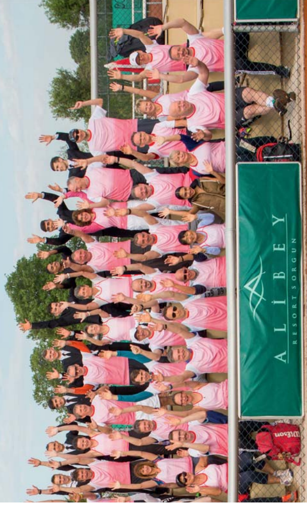
RIESENSTIMMUNG: Beim Leistungs-Camp des Bayerischen Tennis-Verbandes kommt neben Tennis das Urlaubsgefühl nicht zu kurz.