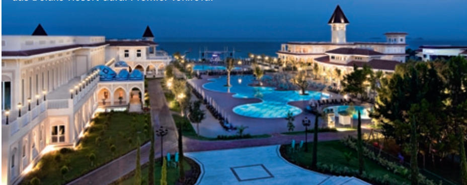
ABENDSTIMMUNG IN DER LUXUSANLAGE: das Deluxe-Resort Güral Premier Tekirova.

Die Patricio Weltklasse Tenniscamps befinden sich direkt in den Clubanlagen. Sie sind jährlicher Austragungsort für Tennis-Events für Hobby- und Breitensportler sowie für Weltklassesportler. Jedes Jahr finden zahlreiche Tennishighlights, wie zum Beispiel die Senioren-Weltmeisterschaften oder zahlreiche ITF-Turniere, Patricio Weeks mit Starcoaches wie Patrik Kühnen und neue verschiedene LK-Events statt (Termine unter patricio-sport-events.com ). In allen Patricio Tenniszentren, Belek (34 Plätze), Manavgat (63 Plätze), Tekirova (16 Plätze) und