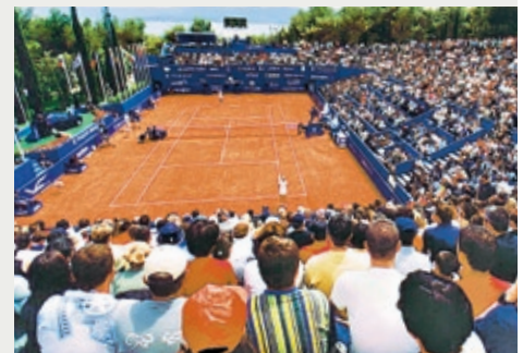
HOCHKLASSIGE TENNISLOCATION: Das Stadion bietet Platz für rund 2.000 Zuschauer.

Die PCT-Tennisschule bietet für Tennisspieler aller Leistungs- und Altersklassen verschiedene Kurse und Trainingsprogramme an. Egal ob Anfänger oder Fortgeschrittene – jeder Teilnehmer wird unter der Anleitung eines qualifizierten, spielstarken Trainer- und Lehrerteams optimale Trainingserfolge erzielen, auch die Kleinen in der Patricio Kids Tennis Fun-Academy. Für alle Tennisfans gibt es kostenlose Schnupperstunden, Tiebreakturniere zum Kennenlernen, wöchentlich stattfindende Turniere mit Preisen, eine Spielpartnerbörse, einen Tennis-Pro-Shop, der Ihnen das neueste Equipment und einen 24-Stunden-Bespansservice bietet, sowie einen adidas- und Wilson-Store.