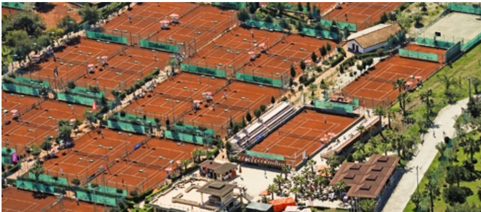
DIE GRÖSSTE TENNISANLAGE DER WELT: der Ali Bey Club in Manavgat.

MIT PATRICIO TRAVEL TENNISURLAUB DELUXE IN DER TÜRKEI ERLEBEN