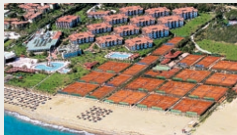
DIE BELIEBTE TENNIS-OASE: der Güral Premier Club in Belek.

Side (4 Plätze), bietet die renommierte PCT Tennisschule Trainingsprogramme und Tennis-kurse für alle Leistungs- und Altersklassen an. Der Ali Bey Club Manavgat sowie Ali Bey Resort Side verfügen zudem über ein professionell ausgestattetes Fitnessstudio von „Fitness First“, dem führenden Betreiber von Fitnessanlagen.