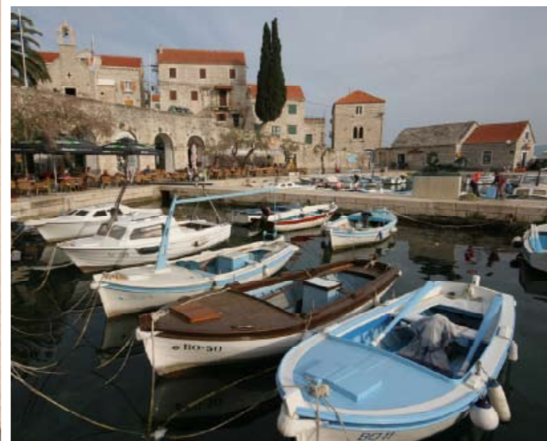
Hafen und Meer: Die Fähren vom Festland legen im kleinen Hafen von Bol an. Von den Tennisplätzen ist die Adria zu sehen.