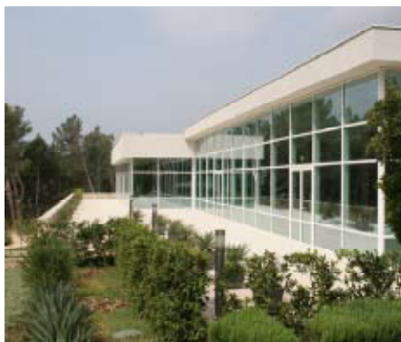
Glas und Spaß: Die Fassade des Elaphusa und Kindertraining in der PCT-Tennisschule.