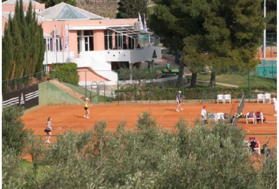
Kaffee und Equipment: Im Clubhaus gibt es ein Café sowie einen gut sortierten Tennisshop.

kann. Wem Tennis nicht reicht, der kann sein Training im Fitnessraum fortsetzen und anschließend entspannen. Bereits auf der Treppe, die hinunter zum mehr als 3000 Quadratmeter großen Wellnessbereich führt, riecht es nach Massageöl und Saunaaufgüssen.