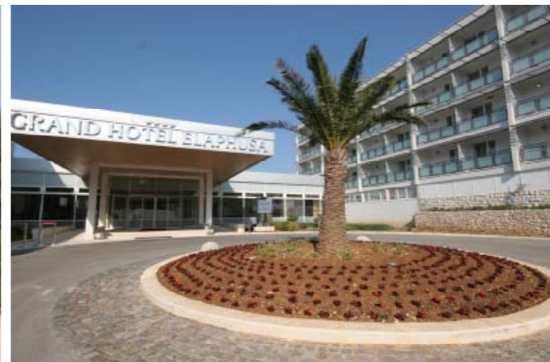
Sport und Komfort: Das Grand Hotel Elaphusa bietet Platz für 600 Gäste. Zur Anlage gehören Außen- und Innenpools sowie eine Strandbar.

Egal, wie es auf dem Platz zugegangen ist, kaum ist eine Trainingseinheit oder ein Match beendet, ist einer der sechs Platzwarte da, um zu wässern oder Löcher zu schließen. Kein Wunder, dass alle Courts in einem hervorragenden Zustand sind. Auf dem harten Sandboden springen die Bälle so, wie man es sich wünscht, und es gibt nur